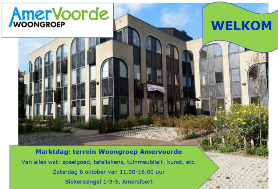
Voorbeeld van de flyer voor de marktdag