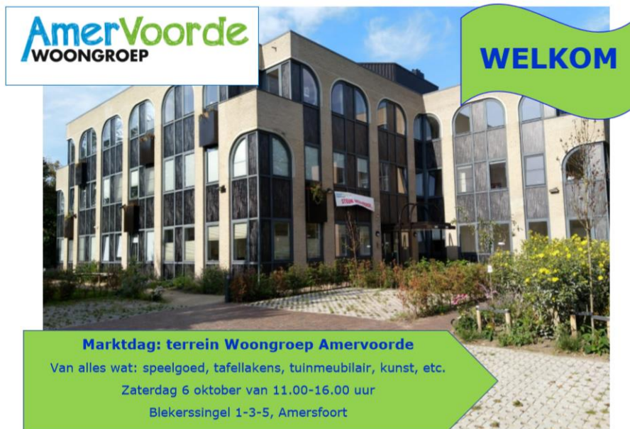
Voorbeeld van de flyer voor de marktdag